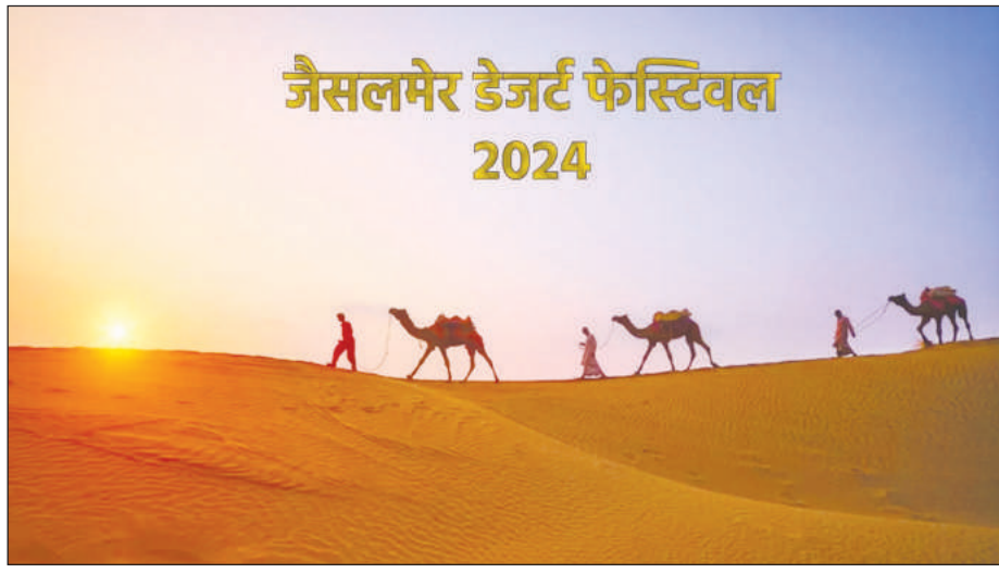
जैसलमेर डेजार्ट फेस्टिभल 2024

राजस्थान आ मुलुगनाडे गावनि आगोमा हारिमु, मिलौहाब जानाय-लौनाय, आंगो भिरसत आरो रंगिना-संगिना गाब गोनां फोर्बोफोरनि थाखाय मिथिसार जायो। जानुवारि-फेब्रुवारि दानआव बेयाव गोबां फोर्बोफोर खुं नाय जायो। मानोना राजस्थानआव दावबायनायनि साबसिन समानो जादों गोजां बोथोर। बेफोरनि गेजेराव मोनसे मख जाथाव फोर्बोआ जादों, जेसलमेर डेजार्ट फेस्टिभल, जायखौ मारु महत्सब मुडेबो मिथिनाय जायो। बेयो राजस्थान दावबाय बिफानआ खुंफुनाय सान 3 नि हाबाफारिजों खुंजानाय फोर्बो। बे फोर्बोआव बाहागोयारि जानानै मोसानाय, सुबुं देखो रोजाबनाय आरो उट गाडनि बादायलायनाय बायदि गोसो बोनो हानाय एडभेन्सरफोरनि गोजोन्नाय लानो हायो। बोहैथि बोसोयव जेसलमेरनि इन्टरनेसनेल डेजार्ट