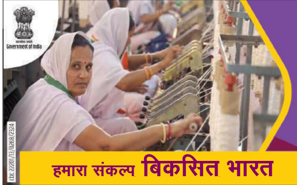
हमारा संकल्प विकसित भारत

BODOSA ★ A Bodo News Daily ★ Wednesday ★ 14 February, 2024 Kokrajhar, BTC, Assam ★ Vol.-33, Issue No.316 ★ R.N.I. Regd.No. 40994/91, Assam Govt. Regd.No.IPRD.40/2006/3, ★ Rs.8/-