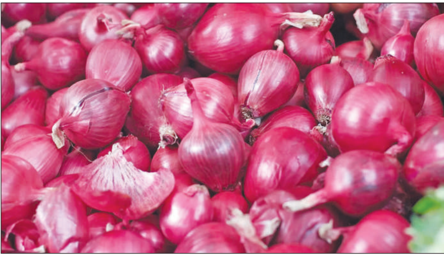
थोजासे मोनहोनो थाखाय 31 मार्च 2024 सिमआव सामब्रामनि एक्सपर्टखौं

गोदान दिल्ली, 11 डिसेम्बर: हादरआव थाबैनो सामब्राम गोजारखौं बाडाइ बेसेनआव मोनो हासिगोन। कन्जुमार केसफोरनि नेहाथारि रहित कुमार सिंआ फोरमायदोदि, सरकारआ 2024 नि जानुवारिसिमआव सामब्राम गोजानि बेसेनआ 1 कि:ग्रा:आव 57.02 रॉनिफ्राय दावखलायनाने 40 रॉआव सौडै नो हागौं। थांनाय सप्ताहआव सरकारआ सामब्राम गोजानि बेसेनफोरखौं कन्ट्रल खालामनो आरो हादरआव